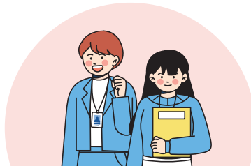
발달재활서비스제공을 위한 재활심리 전문 인재 양성