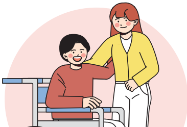
장애인지원서비스 제공을 위한 재활심리 전문 인재 양성