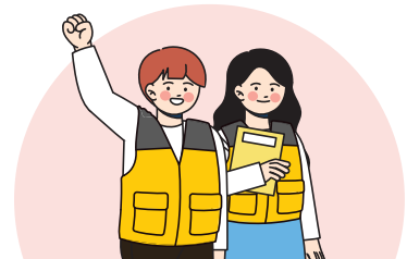
근로지원인, 장애인활동지원 서비스 제공인력 양성